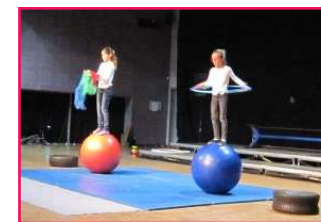
Cirque Pietro (association Ap'art)

Un stand d'informations ainsi qu'une buvette (avec boissons, gâteaux et confitures) étaient proposés tout au long de l'après-midi.