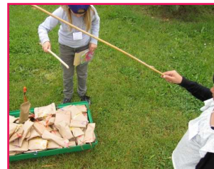
Pêche à la ligne