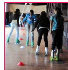
Atelier rollers (UPAR)