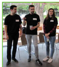
Les étudiants de l'IUT

Nous remercions tous les partenaires, les bénévoles et les participants qui ont fait de cette journée une grande fête :