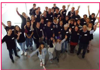
L'équipe Parrainage 17