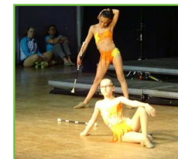
Twirling (club rochelais)