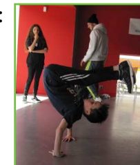
Initiation hip-hop (Collectif Ultimatum)