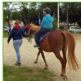
Tour à poneys (SHA)