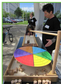
Jeux géants en bois (La Grosse Boîte)