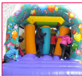
Structure gonflable (Les Petites Puces)

Malgré une matinée incertaine sous la pluie, le soleil a fait son apparition en début d'après-midi. Plusieurs activités ont pu être maintenues en extérieur :