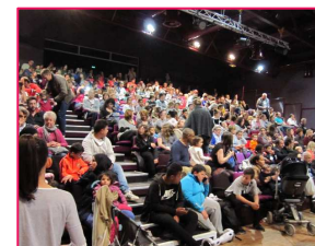
La salle est pleine !

L'après-midi s'est poursuivie avec des spectacles en salle : cirque, twirling, patinage artistique à roulettes, hip-hop.