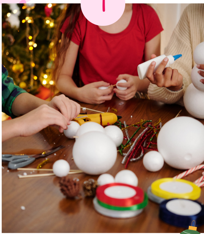
Création de boules de Noël

A quelques semaines du réveillon de Noël, la décoration du sapin est certainement en cours. Cette pièce reste un élément central des fêtes de fin d'année. Pourquoi ne pas tenter de fabriquer soi-même ses boules pour l'habiller, décorer la maison ou encore la table.