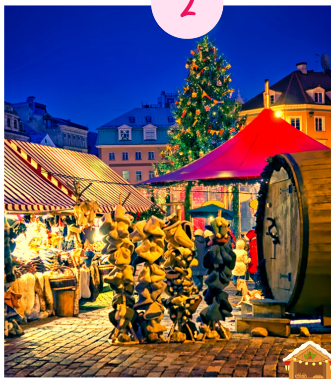
Visiter un marché de Noël

Visiter le marché de Noël de votre ville ou celle des alentours afin de s'imprégner de l'esprit de ces fêtes. C'est une bonne opportunité pour passer un moment en famille ou entre amis. En plus, les enfants adorent faire des tours de manège ou y rester jusqu'à la nuit tombée pour y admirer les illuminations.